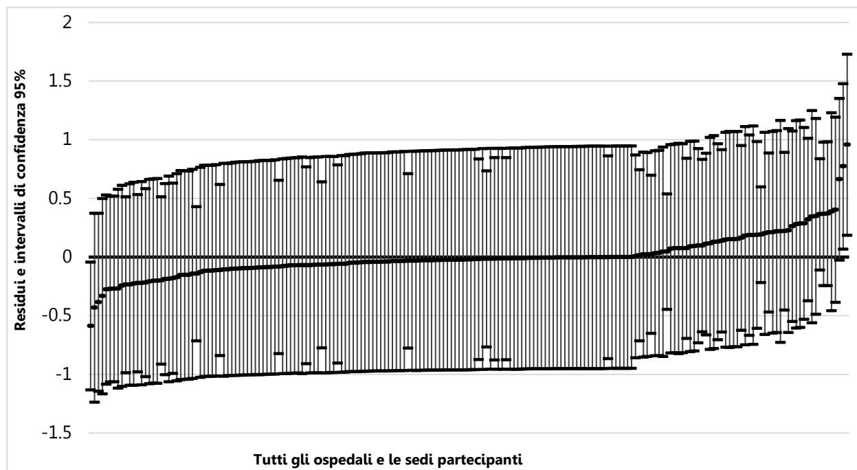
Figura 2: residui del livello di ospedale e intervalli di confidenza (95%), tutti gli ospedali e le sedi partecipanti - decubito nosocomiale categoria 2-4

L'analisi globale mostra che tre ospedali si differenziano in modo significativo dalla media. Anche in questo caso si constata una notevole omogeneità, determinata però da un numero di casi ancora più contenuto, visto che è stata esclusa la categoria 1.