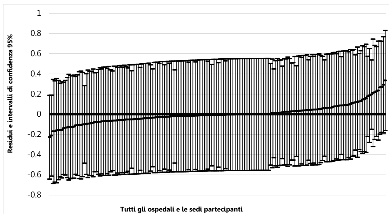
Figura 3: residui del livello di ospedale e intervalli di confidenza (95%), tutti gli ospedali e le sedi partecipanti - cadute in ospedale

Nessun ospedale diverge in modo significativo dalla media. Anche in questo caso, si constata dunque una grande omogeneità tra gli ospedali e le sedi.